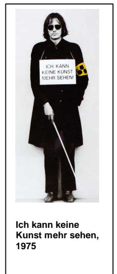
Ich kann keine Kunst mehr sehen, 1975

einem Endpunkt führt und nicht nur Flaschentrockner, sondern sich selbst ausstellt“. Er erklärte sich 1961 zum „ersten lebenden Kunstwerk“ und stellte sich konsequent 1966 in einer Galerie in Frankfurt selbst aus, signiert natürlich. Damit hat er entscheidend zur Erweiterung des Kunstbegriffs beigetragen. Ihn in einer künstlerischen Schublade zu verorten fällt schwer. Zu vielseitig ist sein Werk: Er ist sowohl Konzept-Künstler, als auch Bildhauer, Performer, Dichter, Archivar und vieles mehr - eben Totalkünstler. Jede Aufgabe, sei sie selbst gestellt oder von außen kommend, geht er mit neuen Ideen und